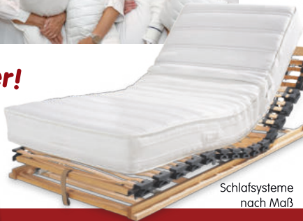
Schlafsysteme nach Maß